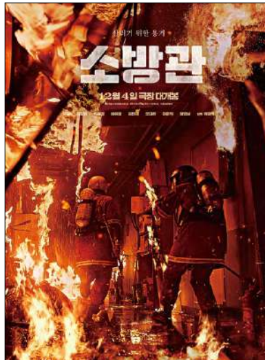
소방관 2024. 12. 4 개봉