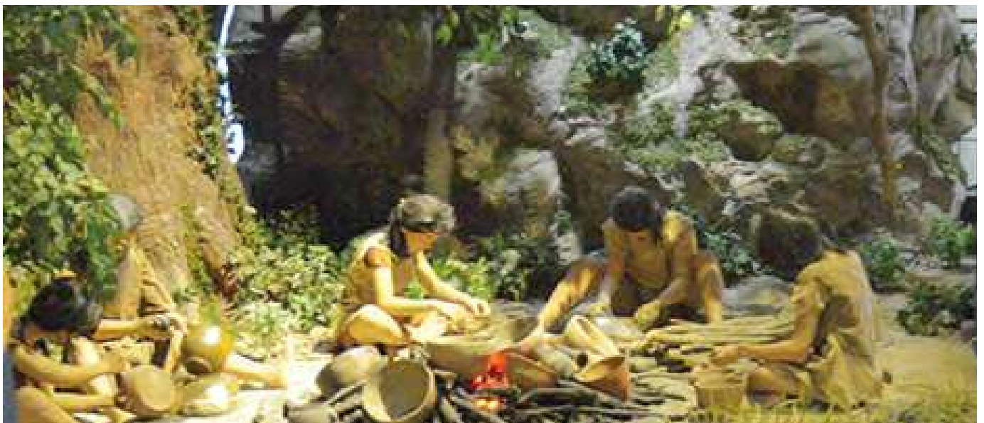
오산리 신석기인 생활 모습

신석기 시대까지는 계급이 없는 평등한 공동체로 생활하였으나 청동기 시대부터는 농업 생산력 증가로 사유재산이 생겼고 빈부격차와 계급이 발생하였다. 움집은 주로 바닷가나 강가에 위치하는데 주변보다 낮게 움(구덩이)을 판 후 바닥을 다져서 가운데에 화덕을 설치하고 기둥을 세우고 지붕을 얹었다. 구석기 시대의 뿔석기에 비하면 크기가 작고 모양도 매끄러운 간석기를 사용하였는데 지금의 믹서기 역할을 하는 갈돌과 갈판이 있으며, 돌낫과 화살촉 등이 있다.