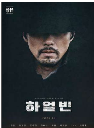
하얼빈 2024. 12. 25 개봉