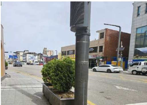
담당부서 : 도시계획과 도시경관팀

군 관계자는 “유관기관과 지속적으로 불법자동차 단속을 실시해, 안전한 자동차 관리문화 정착 및 교통안전 확보에 노력하겠다”고 말했다.