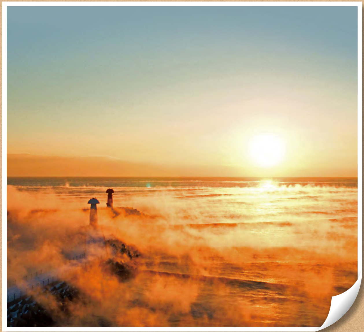
물치 해수욕장 등대 (2024년 11월 24일 촬영)