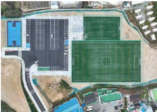
담당부서 : 교육체육과 체육시설팀

이번 협약은 양양군의 지역특화 임대형 스마트팜 공모사업과 연계하여 청년창업농 육성과 스마트농업 활성화를 목표로 한다. 양양군과 강원대학교 사업단은 상호 협력하에 향후 5년간 스마트팜 창업농 지원 및 교육·운영을 공동으로 추진할 계획이다.