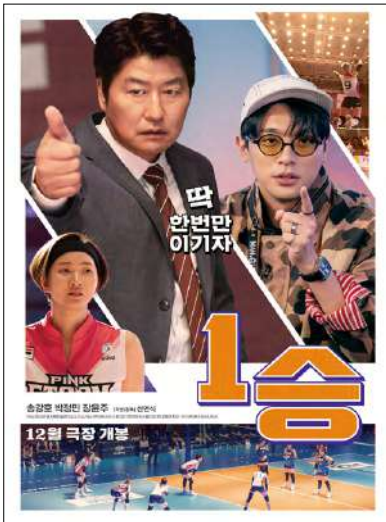
1승 2024. 12. 4 개봉