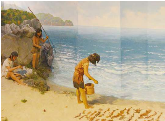
신석기인 어로행위 모습

우리나라의 구석기 시대는 약 70만년 전의 중기 구석기부터 1만년 전까지이고, 신석기 시대는 1만년 전부터 청동기 시대인 4천년 전까지라고 한다. 구석기 시대는 빙하기로 추웠으며 신석기 시대는 간빙기로 기후가 지금처럼 따뜻해지기 시작하였다. 기후가 온난해지자 사람들은 밭농사 위주의 농경을 시작하고 가축을 키우면서 이동을 멈추고 움집을 짓고 정착을 시작하게 되었다. 그러나 여전히 열매의 채집과 사냥, 고기 잡이는 계속하였다.