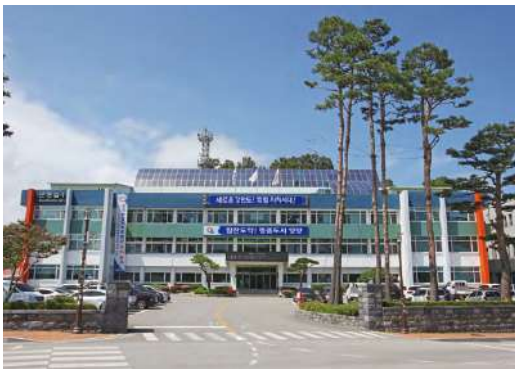
담당부서 : 안전교통과 교통지도팀

※ 서비스 가입 : 거주지와 관계없이 누구나 ① 양양군 홈페이지( https://parkingsms.yangyang.go.kr ) 또는 ② 통합가입도우미 앱 다운로드 또는 ③ 양양군청 및 읍면사무소 방문