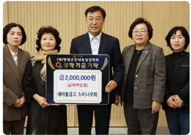
■ 인재육성장학금-새마을금고 느티나무회