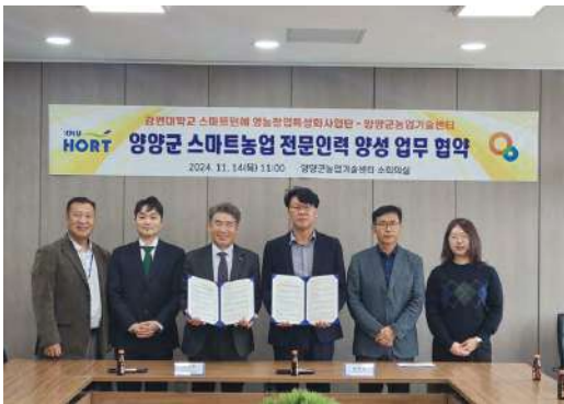
담당부서 : 농업기술센터 기술지원과 스마트팜팀

“후진항이 매력있는 어촌마을, 지속가능한 어촌마을이 될 수 있도록 최선을 다할 것”이라고 밝히며, 주민들의 적극적인 참여와 협력을 당부했다.