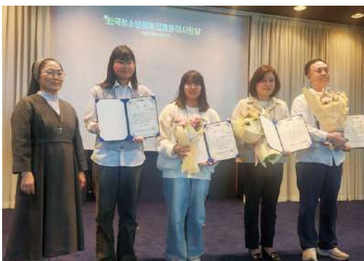
담당부서 : 교육체육과 드림청소년팀

군 관계자는 “공공시설물을 이용한 불법광고물 부착으로 단속에 많은 행정력이 투입된다”며 “이런 낭비적 요소를 최소화함은 물론 도시미관 개선을 위해 노력하겠다”고 말했다.