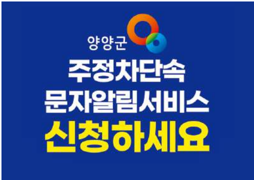
담당부서 : 안전교통과 교통지도팀