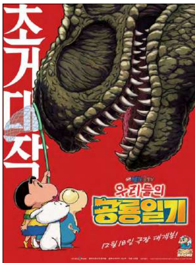
짱구는 못말려 - 우리들의 공룡일기 2024. 12. 18 개봉