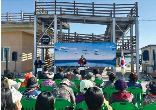
담당부서 : 해양수산물과 어촌어항TF팀