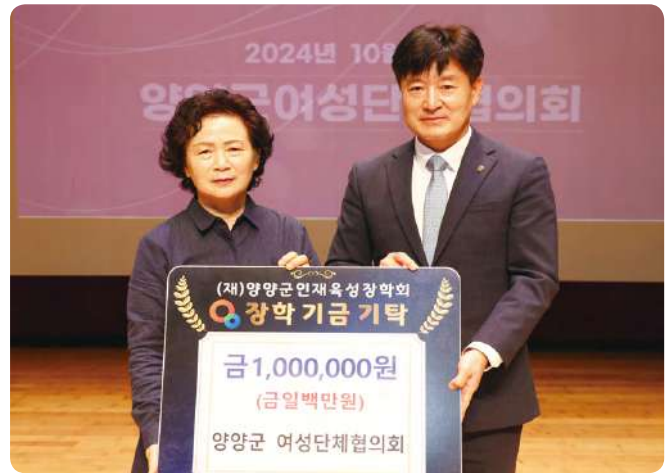
■ 인재육성장학금-양양군 여성단체협의회