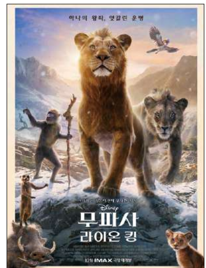
무파사-라이온킹 2024. 12. 18 개봉

※ 개봉날짜는 배급사와 영화관의 사정으로 변동될 수 있으니 자세한 사항은 양양작은영화관 홈페이지를 통해 확인해 주세요 양양작은영화관 공식홈페이지 : https://yangyang.scinema.kr