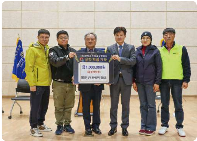
■ 인재육성장학금-양양군 5개 봉사단체 협의회