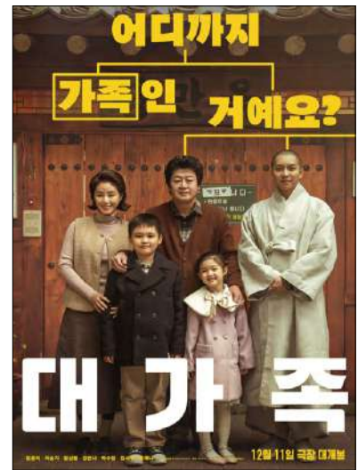
대가족 2024. 12. 11 개봉