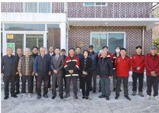
담당부서 : 산림복지과 산림보호팀

새롭게 조성된 체육시설은 주변 정비를 거쳐 12월 중 개방될 예정이며 현남면사무소를 통해 이용 신청할 수 있도록 할 계획이다.