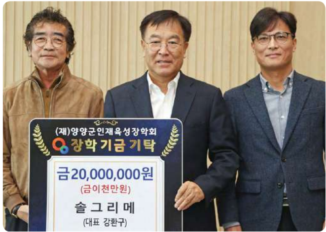
■ 인재육성장학금-솔그리메(대표 강환구)